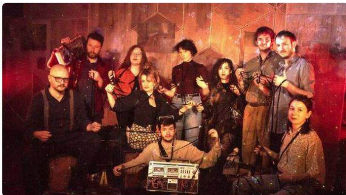
Mémé K7, 10e collectif de Kreiz Breizh Akademi, est un orchestre composé de cinq femmes et cinq hommes.

Après une année de formation, Mémé K7, 10e collectif du Kreiz Breizh Akademi, enflamme parquets de bals et scènes de festival. Vendredi 16 mai 2025, il mettra le feu à l'Espace Koëd Noz de Ploërdut (Morbihan).