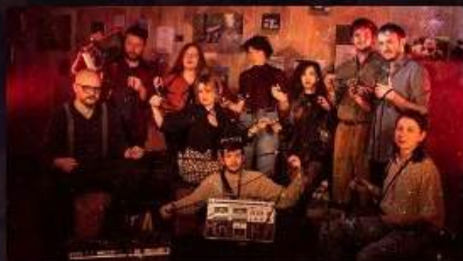
La 10e promotion de la Kreiz Breizh Akademi qui porte le projet Mémé K7