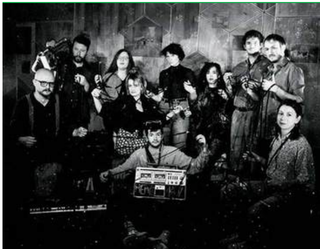
Avec la Kreiz Breizh Akademi, les chants bretons se mêlent d'accents basques ou orientaux.