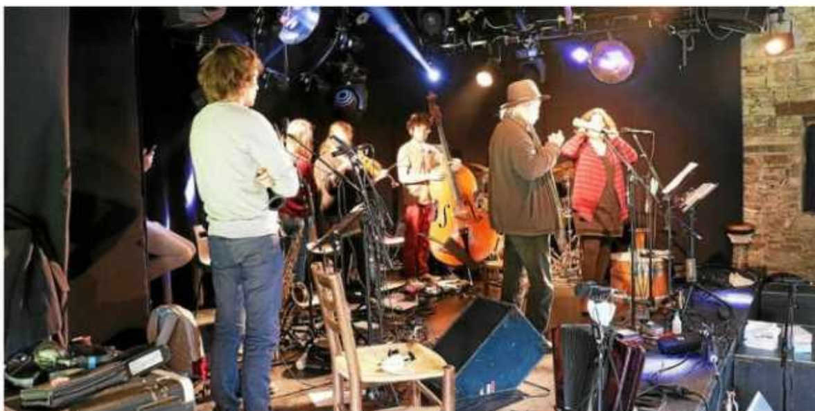
Le Run ar Puñs a accueilli la Kreiz Breizh Akademi pendant trois jours.