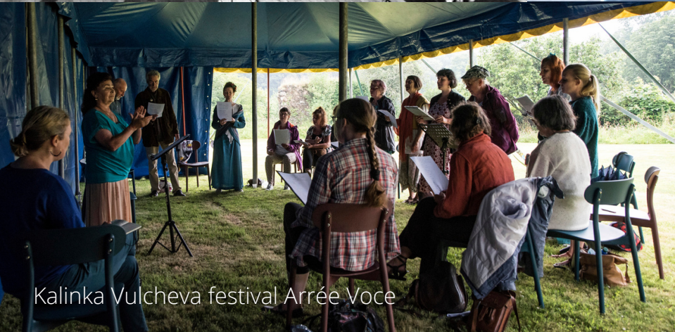
Kalinka Vulcheva festival Arrée Voce