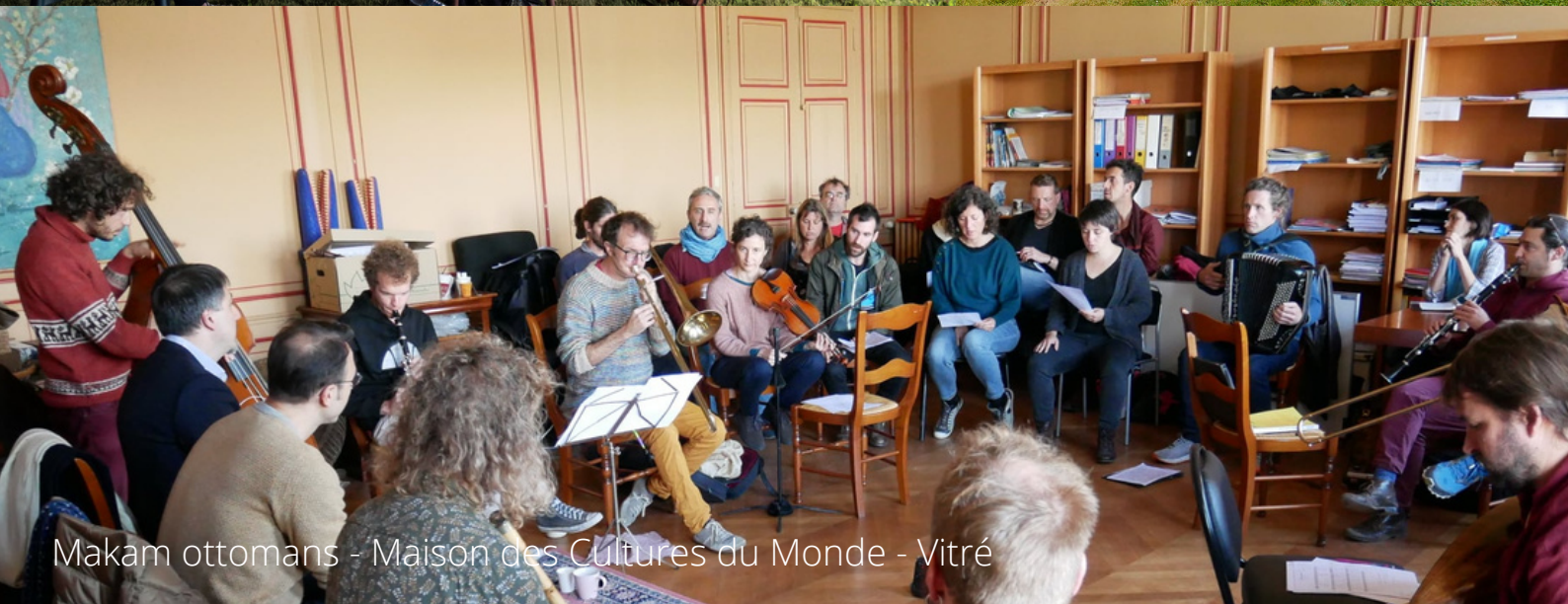
Makam ottomans - Maison des Cultures du Monde - Vitré