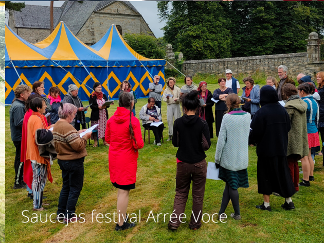
Saucejas festival Arrée Voce