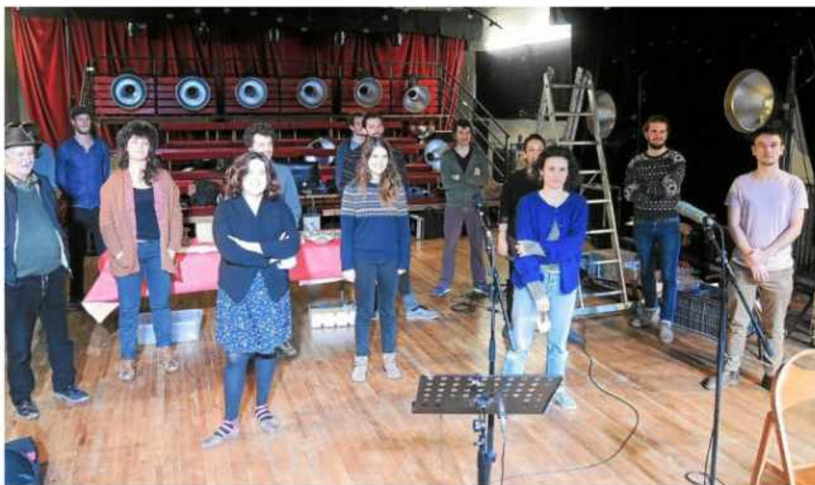
La Kreiz Breizh Akademi #8 lors de sa remise de diplôme dans la salle de bal de La Grande Boutique.