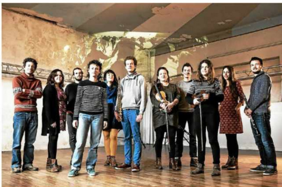
Le 8e collectif de Kreiz Breizh Akademi se produit, vendredi soir, sur la scène de Run ar Puñs.