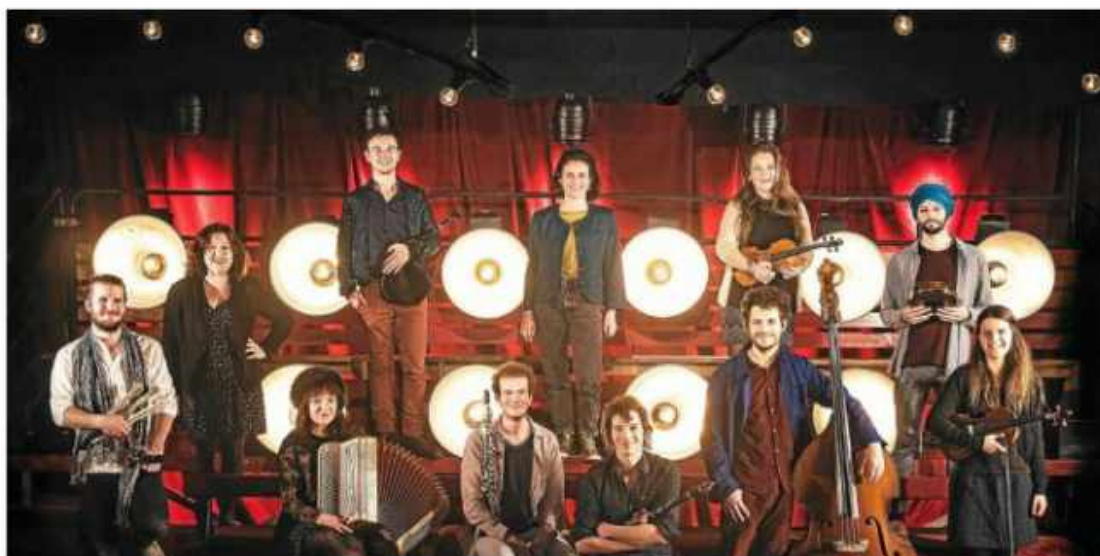
Amzer Nevez lance ce jeudi avec la Kreiz Breizh Akademi #8 : Ba'n Dañs, (Photo AMZER)