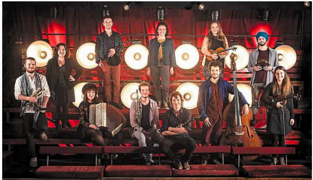
Les neuf musiciens et les deux chanteuses du collectif de Kreiz Breizh Akademi lancent les festivités de la Bogue, jeudi, au Canal théâtre, avec leur répertoire de musique bretonne à danser.