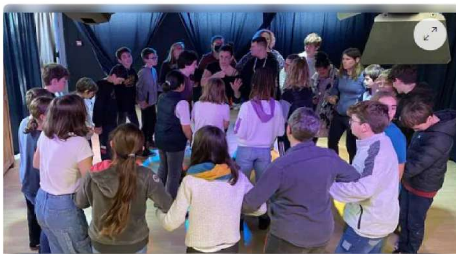
Afin de favoriser l'inclusion au collège Saint-Gildas, un partenariat avec l'association Drom est mis en place.