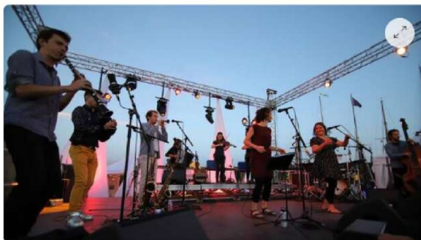
Vendredi dernier, les membres du 8e collectif de la Kreiz Breizh Akademi ont fait danser le public des fêtes maritimes de Douarnenez. Ils remettent ça ce soir à Quimper pour l'inauguration du festival de Cornouaille.