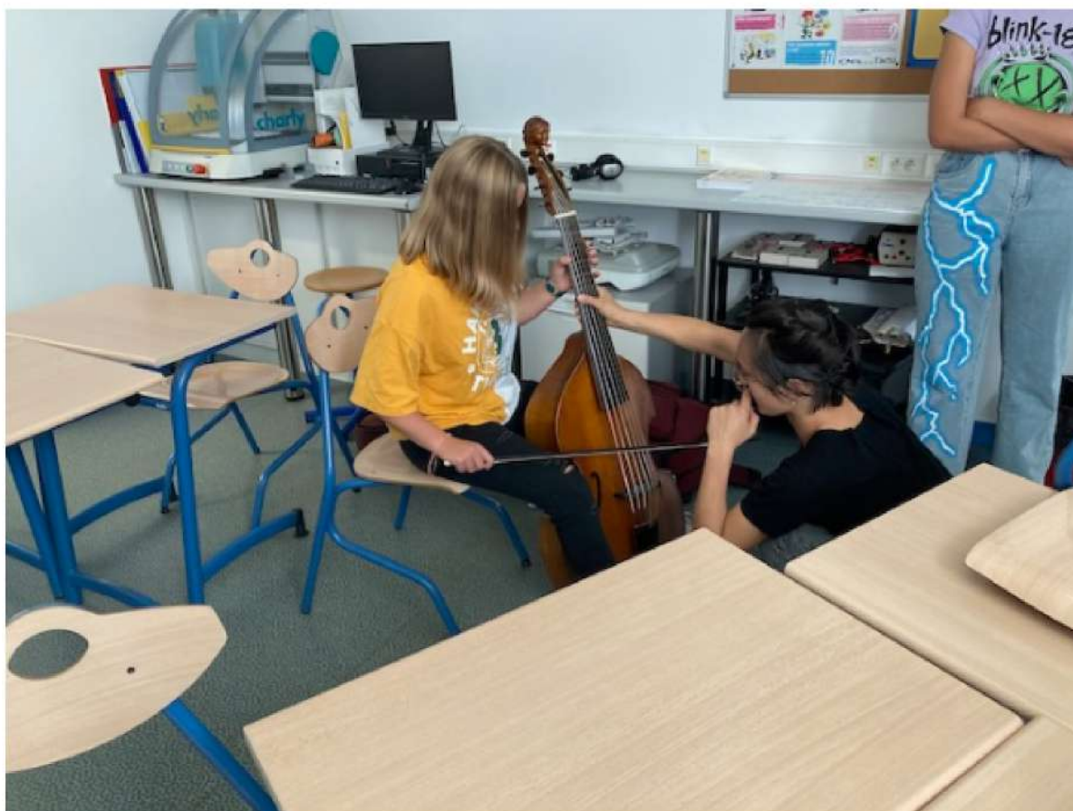
le viole de gambe