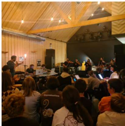
Repétition à l'Eskal

Nous sommes allés voir le groupe répéter à l'Eskal.