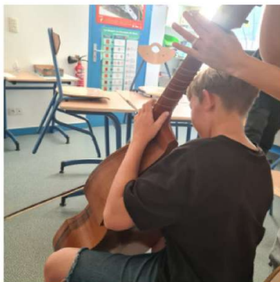
Eleve avec une viole de gambe

Ensuite, quelques musiciens sont venus au collège pour nous faire découvrir la musique bretonne. Nous avons pu tester leurs instruments : violon, violon alto, violoncelle et viole de gambe. Ils nous ont aussi appris à danser une danse bretonne (plinn), et à chanter en Kan a Diskan.