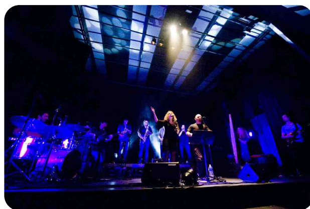
1er concert de KBA#3

Dates & lieux : 18-19-20 décembre 2014 à la Grande Boutique, Langonnet